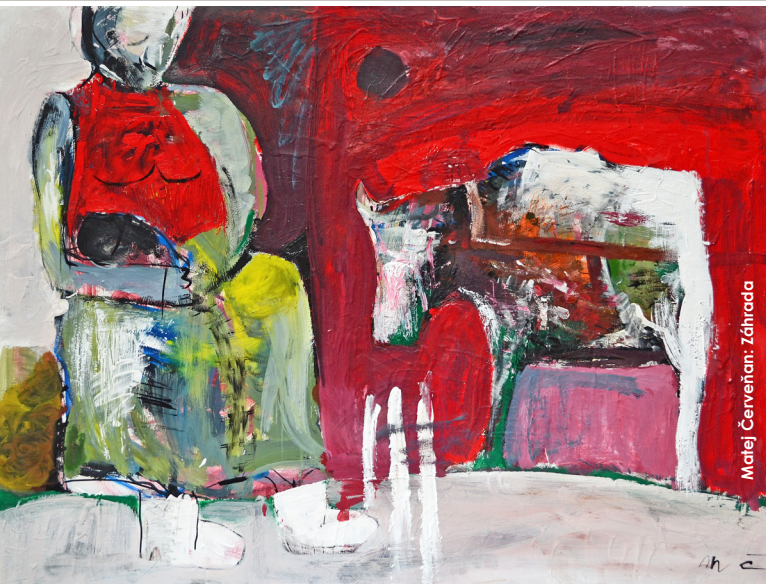
Maja Červeňan: Záhrada

Otvorené pondelok – piatok od 13.00 – 17.00 h, sobota od 9.00 – 12.00 h do 16. apríla 2018